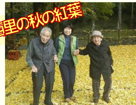
↑西里・やませみの湯、大きな銀杏の木の下、黄色いじゅうたんのの上をお散歩してきましたよ。