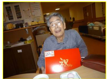
「私たちもいただいたよっ！」