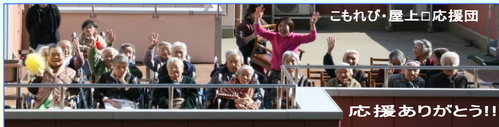
こもれび・屋上応援団