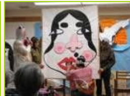
超特大の『福笑い』いい顔ができましたね

特養の新年会 はスタッフがそ れに工夫を凝 らした出し物 がいっぱい です。大っき な大っきな『 福笑い』や利 用者の皆さん と一緒に猛特 訓を重ねて上 手に演奏でき た『銭太鼓』 その他にも座 布団配りも楽 しかった『大 喜利』や太田 社中の皆さん の『春の踊り』 、理事長さん が本格的？に 始めた『安来 節』に『獅子 舞』の披露な ど。 デイサービスの 舞台上で繰り 広げられる楽 しくて面白い 出し物に、お 腹を抱えて笑 ったり、歌っ たり、今年も 一年、みんな がこんな笑顔 で過ごせるよ う頑張りたい ですね。