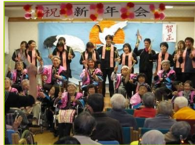
利用者さんも一緒に『銭太鼓』です