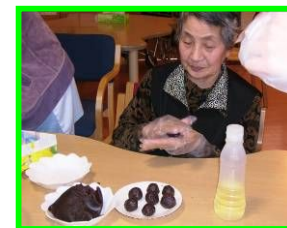
「さくら餅」上手く出来たね