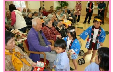
「ひ孫みたいにかわいいね」