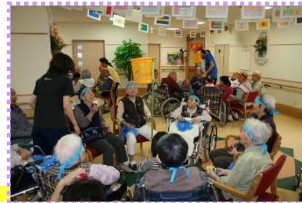
玉入れもユニット対抗戦だよ!