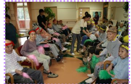
準備万端! 競技開始だよ!