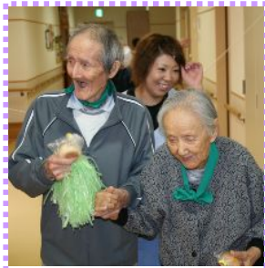
こんなにほほ笑ましい光景も!

十月の行事は何と言っても運動会。 各階にあるセミパブリックスペース(ミニ公園)を使 ってユニットごとの対抗戦です。玉入れにパン食い競 争、風船運びリレーと行い、総合得点で優勝を目指し ます。選手の皆さん、スタート前は少し緊張気味でし たが競技が始まると笑顔もいっぱい、元気もいっぱ い、スタッフの手を振り切つて猛烈タッシュユ〜してゴ ールを目指していましたよ。