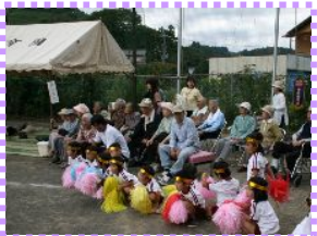
保育園の運動会も見にいったよ