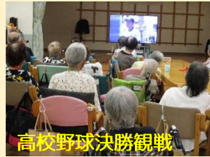
高校野球決勝観戦