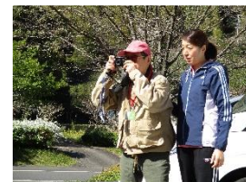
桜見学に行きました。まるで昔のバス旅行見たいでしたよ♪