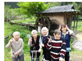
クラブでの野外活動、トレーニングやミステリーツアー等に参加しました